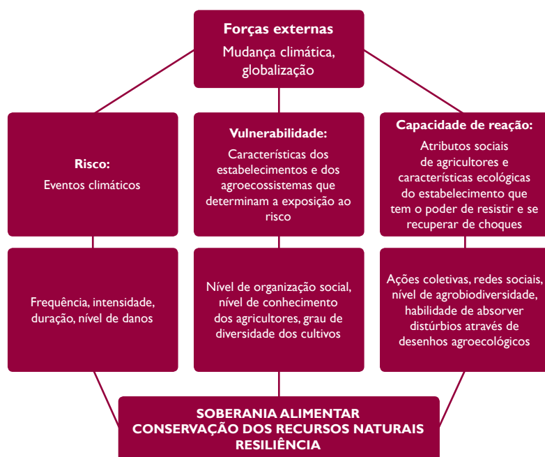
Figura 1. Características socioecológicas determinantes da vulnerabilidade dos agroecossistemas e da capacidade de adaptação dos agricultores (NICHOLLS et al., 2013)

capitais. Como ilustrado na Figura 1, a vulnerabilidade de um agroecossistema é determinada por sua infraestrutura agroecológica (na escala da paisagem, de espécies e variedades cultivadas, qualidade e cobertura do solo etc.) e pelas características das famílias e/ou das comunidades (nível de organização e trabalho em rede, autossuficiência alimentar etc.).